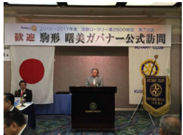
足立PDGより締めめのスピーチ