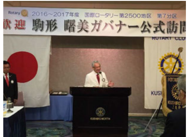
北川会員の4つのテスト