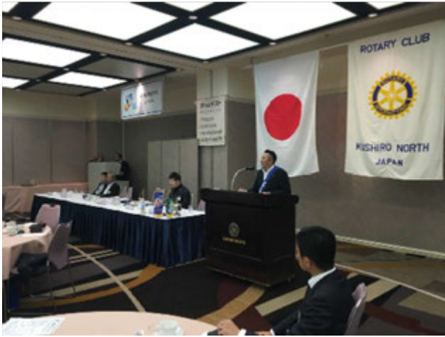
仁木君の発表の様子