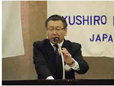
徳山国際奉仕委員長