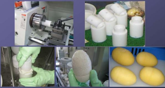
型の量産とチーズの製造