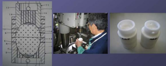
釧路工業技術センターでの型の試作

ナチュラルチーズ用特殊モールドの開発 鶴居村の委託を受け、たまご型ナチュラルチーズ用モールドのプロトタイプを開発。